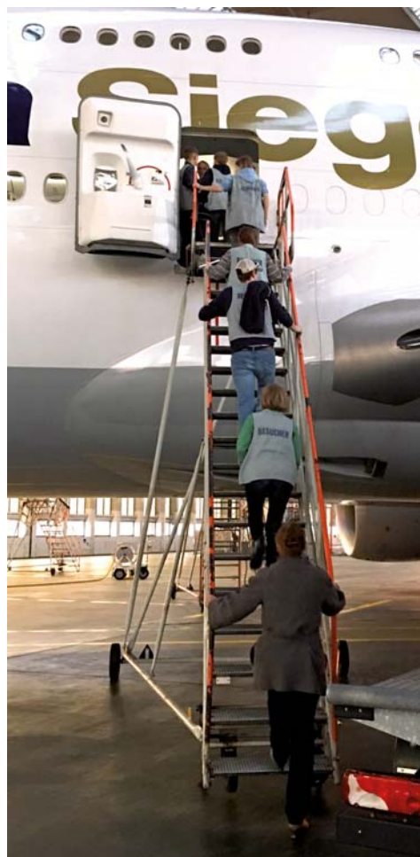
Wiesbadener Schweizer auf Klettertour in den Technikhallen des Frankfurter Flughafens

Polit Talk mit anschliessendem Austausch beim Abendessen im Sombrero Latino