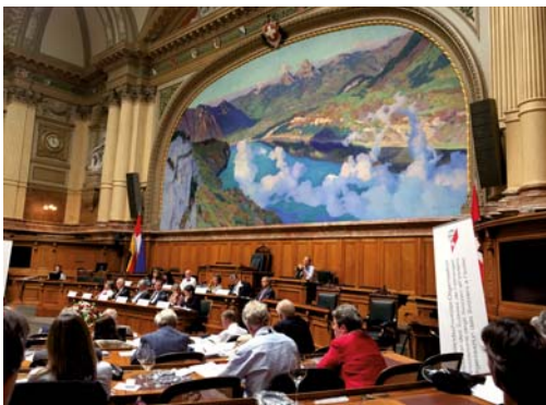
Sie könnten 2017 dabei sein: Die Tagung des Auslandschweizerrates im vergangenen August im Bundeshaus in Bern

In diesem Jahr ist es wieder so weit. Der 140 köpfige Auslandschweizerrat, auch Parlament der fünften Schweiz genannt, wird neu gewählt.