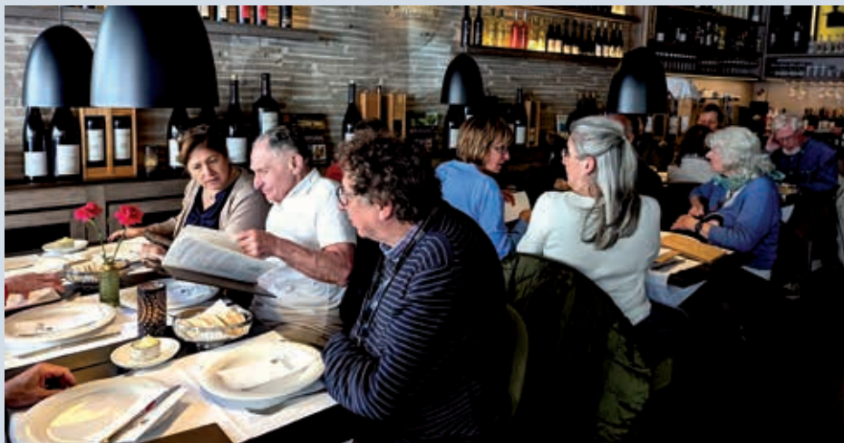
Den Hauptgang gab es im NAU, dem portugiesischen Restaurant nahe den Landungsbrücken.

Vom Michel aus ging es Richtung Elbe, auf vielen Schleifen und Windungen durch die engen Strassen dieses Quartiers, das seinen Namen eigentlich erst seit den 70er-Jahren hat, als sich Portugiesen in den damals renovierungsbedürftigen Gründerzeithäusern niederliessen. Man hatte sie als Arbeiter vor allem für die Hamburger Werften angeworben und dort fanden sie günstigen Wohnraum in der Nähe zu ihren Arbeitsplätzen. In der Folge entwickelte sich hier ein reichhaltiges Angebot an portugiesischen Restaurants und Cafés, die das Viertel mit quirligem Leben füllten. Direkt davor, an der Elbpromenade an den Landungsbrücken, liegt das Museumsschiff «Rickmer Rickmers». Es erinnert