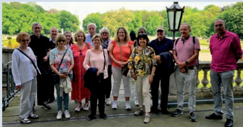
Schweizer Ausflügler vor dem Schloss Nordkirchen

Über die Jahre hatte das Schloss viele verschiedene Besitzer, bis es zu Beginn des 20. Jahrhunderts verlassen wurde und sich in den 40er-Jahren in so desolatem Zustand befand, dass einige Ge-