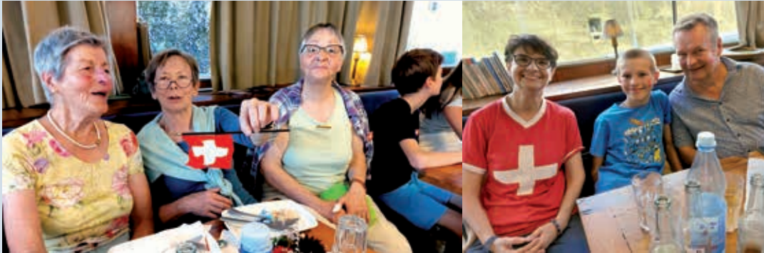
Fröhliche Bundesfeier auf dem Neckar

Zu einer Bundesfeier auf dem Neckar lud die Schweizer Gesellschaft Stuttgart für Samstag, den 20. Juli ein. Siebenunddreissig Personen, jung und alt, teils schweizerisch herausgeputzt mit rot-weissen Shirts, Abzeichen oder mit Schweizer Kreuzchen auf den Wangen, nahmen das Angebot wahr: Sechs Stunden beschauliche Schifffahrt in Rich-