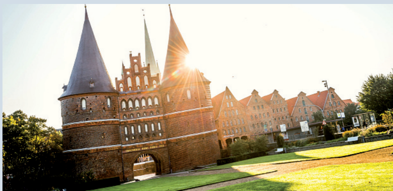
Holstentor und Salzspeicher in Lübeck

Unter anderem soll das Verfahren zur Wahl der Auslandschweizererräte demokratischer werden (s. Bericht S. III). Auch die Verwendung des Geldes im Hilfsfonds soll statutarisch im Hinblick auf etwas variabelere, der Solidarität und Wohlfahrt gleichwohl verpflichtete Einsatzmöglichkeiten angepasst werden. Neben den statuarischen Themen möchten wir Ihnen viel fürs Gemüt und zur Stärkung unserer Verbundenheit bieten. Das Motto «Maritimes Hüttengaudi» verbindet das Meer, Lübeck und die Schweiz in besonderer Weise. Die Schweizer Meeresbiologin Luisa Listmann wird uns über die Bedeutung des Wassers Interessantes berichten. Die Zürcherin Ursula Richenberger, die Leiterin für den Aufbau des Deutschen Hafensemuseums in Hamburg, wird uns für das Schmuckstück des Museums, die legendäre «Peking», ein einzigartiges Segelschiff, begeistern. Natürlich