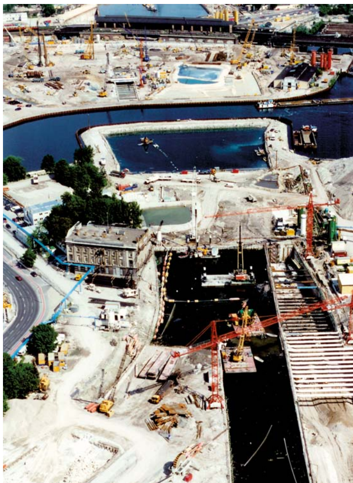
1997: Der Spreebogen während des Baus des neuen Regierungsviertels und des Bahntunnels zum Lehrter Bahnhof. In der linken Bildhälfte ist das Gebäude der Botschaft zu sehen.

Die diplomatische Vertretung der BRD wurde 1949 in Bonn eingerichtet und war von 1957–1977