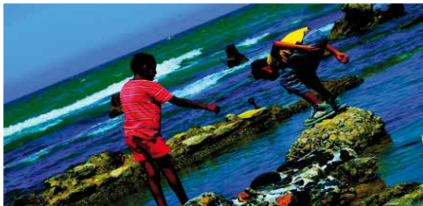
«Bildbuch» – ein Film von Jean-Luc Godard

Jean-Luc Godard setzt mit seinem neuesten Film sein sich alle Freiheiten nehmendes Spätwerk fort. Ein rauschhafter Gedankenfluss, eine assoziative Collage in fünf Kapiteln. Die Sehnsucht nach Freiheit, die Abgründe der Menschheit, die Schönheit des Kinos, Zeit und Geschichte, gedehnt und verdichtet. Kinostart deutschlandweit ab 4. April.