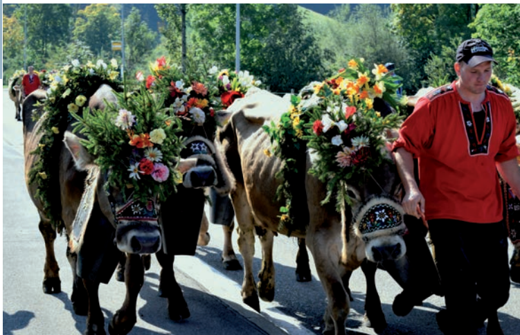
Über 200 Stück herrlich geschmücktes Vieh zogen mit ihren Älplern zu Tale

Am 23. September hiess es für die Mitglieder des Schweizer Vereins Ortenau früh aufstehen, denn um sechs Uhr fuhr der Bus Richtung Entlebuch. Über Rheinfelden und am Sempacher See vorbei brachte uns der Bus unseres Vereinsmitgliedes