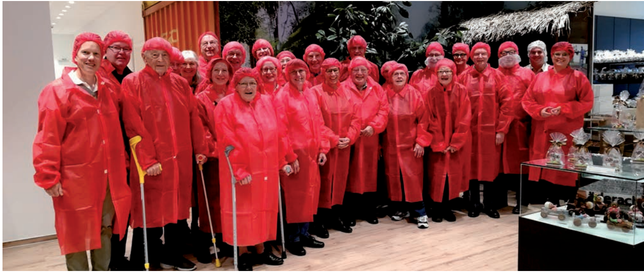
Fertig für die Besichtigung der Schoggiproduktion: Die Mitglieder des Schweizer Vereins Mittelhessen sind «steril» verpackt