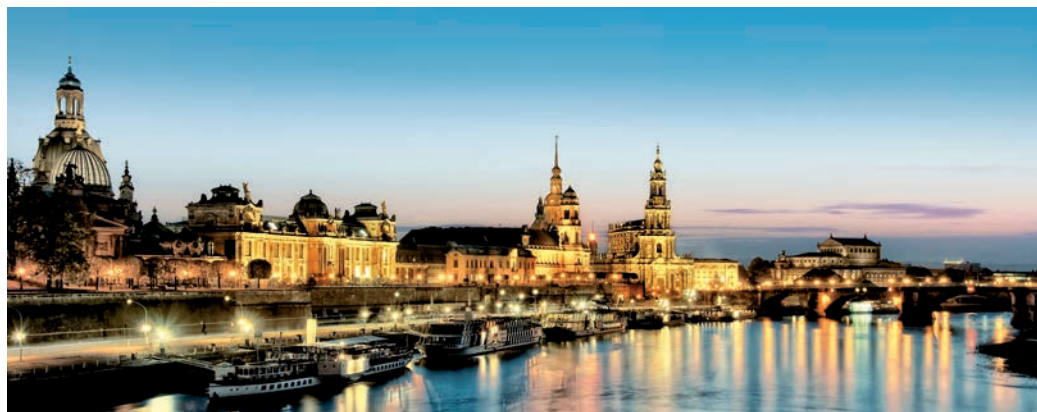
Panorama der Dresdener Innenstadt zur blauen Stunde

Die Kulturstadt an der Elbe hat viel zu bieten: Bewundern Sie die herrliche, wiederaufgebaute Frauenkirche bei einem Sonderkonzert. Erleben Sie Dresden auf einem Rundgang auf den Spuren Erich Kästners, der 1899 hier geboren wurde. In der legendären Schatzkammer, dem Grünen Gewölbe, gibt es grosse «Oper» für die Augen und auf der Elbe eine beschauliche Schifffahrt auf einem nostalgischen Raddampfer. Auch die Kultur und Traditionen der Lausitz werden vorgestellt, denn ein beträchtlicher Teil der hiesigen Vereinsmitglieder wohnt in der Lausitz und im Dresdner Umland – oft als Nachkommen bäuerlicher Auswanderer. Kulinarisch werden Sie mit