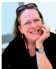
MONIKA UWER-ZÜRCHER, REDAKTION DEUTSCHLAND

■ Was ist ein Aufenthaltstitel? Umgangssprachlich ein Ausländerausweis, den es in Papier- oder in der etwas teureren Plastikkartenversion gibt. Er ersetzt die «Klebeetikette», die früher in den Pass montiert wurde. Dieser Ausweis hat den gros-