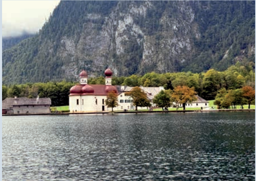
Die barockisierte Wallfahrtskirche St. Bartholomä vor der beeindruckenden Ostwand des Watzmanns

Drei Mal im Jahr erkundet der Schweizer Verein München seine bayerische Heimat. Diesmal ging es an den berühmten Königssee. Der Königssee ist ein Gebirgssee im Berchtesgadener Land und gehört zu den Hauptattraktionen der Umgebung. Eingebettet zwischen den steilen Berghängen von Watzmann und Hagengebirge hat der lang gestreckte See zusammen mit dem südöstlich vorgelagerten kleineren Obersee – um den das Steinerne Meer den Talabschluss bildet – einen fjordartigen Charakter. Kurz vor acht Uhr ging es in München vor dem Schweizer Haus los, und ein voll besetzter Bus fuhr Richtung Königssee. Nach der Ankunft ging es auf ein Schiff Richtung Sankt Bartholomä. Die Überfahrt war schon ein Erlebnis. Vom