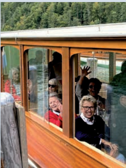
Fröhliche Münchner Ausflügler im elektrisch betriebenen Ausflugsschiff auf dem Königssee

Bootsführer erfuhren wir alles über den Königssee. Der Königssee mit seinem glasklaren Wasser zählt zu den saubersten Seen Deutschlands. Segelboote und Ruderboote dürfen nicht genutzt werden. Nur die elektrisch betriebenen Ausflugs-