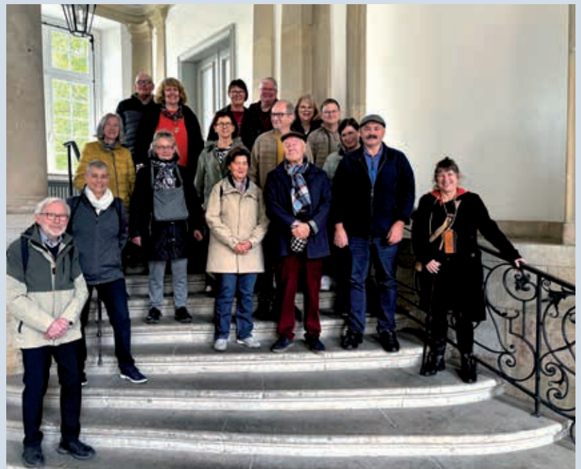
Münsteraner Schweizer liessen sich vom Inneren des Adelspalais beeindrucken.

Am 12. Oktober trafen sich Mitglieder des Schweizer Treffens Münster zu einer Kulturführung im traditionsreichen Erbdrostenhof in der Salzstrasse. Dieser mitten in der Innenstadt gelegene prächtige Barockbau wurde vom Baumeister Johann Conrad Schlaun errichtet und nach Beschädigungen im Zweiten Weltkrieg nach alten Plänen wieder aufgebaut. Besonders beeindruckend war der Barocksaal mit sei-